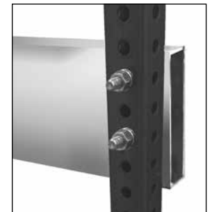
Assemblage facile 5 minutes par côté.