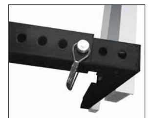
Le système de verrouillage des broches se retire en quelques secondes pour un accès temporaire au châssis.